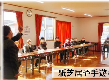
紙芝居や手遊びもしました!