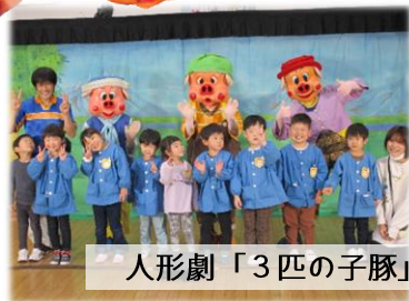
人形劇「3匹の子豚」! たのしかったね♪