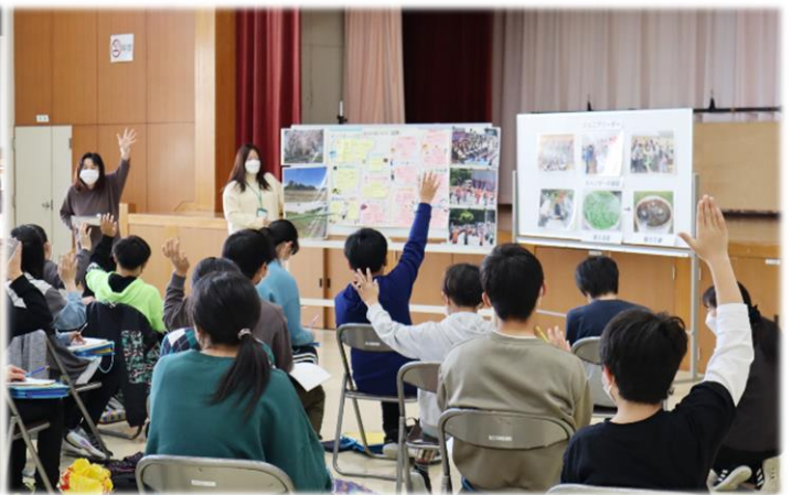
▲11月15日(火)に行った事前学習の様子。公民館職員が南方の現状について説明しました。