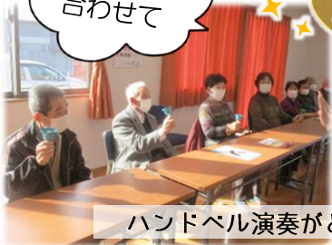
ハンドベル演奏がとても好評でした♪