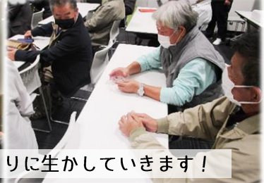
仙台うみの杜水族館でホタルの生態について学んできました。今後の自然環境づくりに生かしていきます!