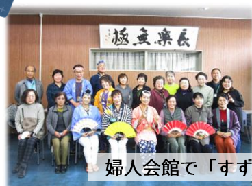
婦人会館で「すずめ踊り」を体験!