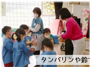
タンバリンや鈴で演奏しました♪