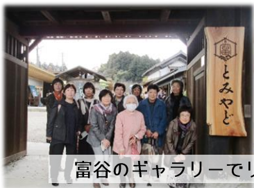
富谷のギャラリーでリメイク小物を見学!