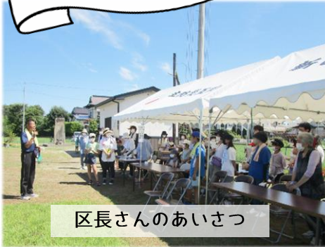
区長さんのあいさつ