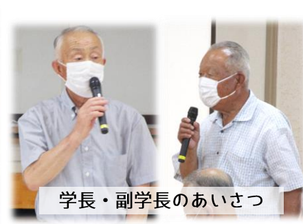
学長・副学長のあいさつ