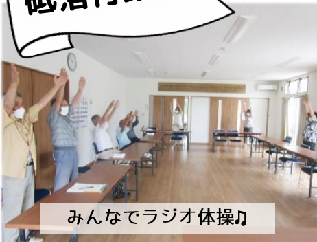
みんなでラジオ体操♪