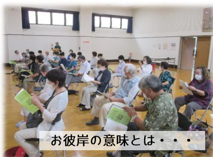
お彼岸の意味とは・・・