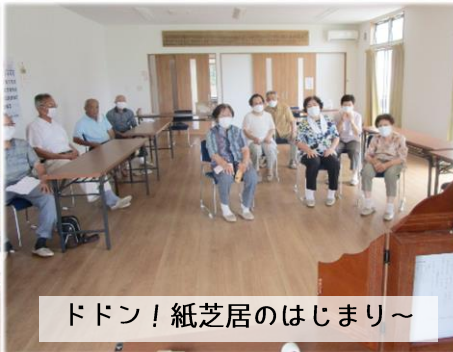
ドドン！紙芝居のはじまり～