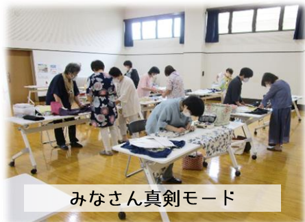
みなさん真剣モード